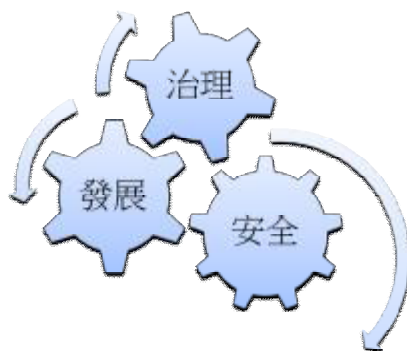
圖三：失敗國家意涵：治理、發展及安全三者連帶關係