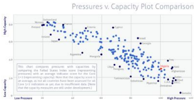
圖四：各國壓力與職能程度分布

團體的影響；(4) 人力長期出走；(5) 發展不均；(6) 貧困及經濟衰落；(7) 國家正當化；(8) 公共服務；(9) 人權及法治情勢；(10) 國家安全機關 (11) 菁英派系及 (12) 外力的介入。 43 2006 年起每年所做失敗國家指數報告，列出「非常高度警戒」、「高度警戒」、「警戒」、「高度預警」等九個等級。列入前二級警戒國家重複性頗高，2009 年及 2010 年前數名均為索馬利亞、查德、蘇丹、辛巴威及剛果民主共和國等；2011 年為索馬利亞、查德、蘇丹、剛果民主共和國及海地。2012 年非常高度警戒國家為索馬利亞、剛果民主共和國兩國；高度警戒國家包括：蘇丹、南蘇丹、查德、辛巴威、阿富汗等。失敗指數惡化常與國內突發或升高的武裝衝突有關。上揭國家同時經歷「低度職能」(公共治理) 及「高度壓力」(經濟社會發展) 的困境，參考圖四。