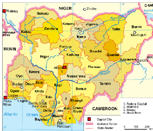
圖五：奈及利亞地圖

洲有四分之一的人口是奈及利亞人。其中北方以信奉伊斯蘭教為主，南方則篤信基督教，前者約佔一半人口，後者約占 40%。奈國共有 350 個族群，也是族群數目最多的非洲國家。獨立之初，因殖民時期的統治，許多族群併而治之，因語言、宗教及習俗差異，時有衝突、殺戮，1960 年代末期的伊博族 (Igbo) 之亂為族群衝突所致的內戰，死亡達百萬。近期內部衝突則好發於南北宗教的仇恨對立。 52 此外，各地區的族群問題、暴力犯罪、販毒、武裝攻擊等，已嚴重危及人民的身家財產，亦使外資卻步，政府已無法扮演安全及秩序的提供者，人身安全保障成為私有財。