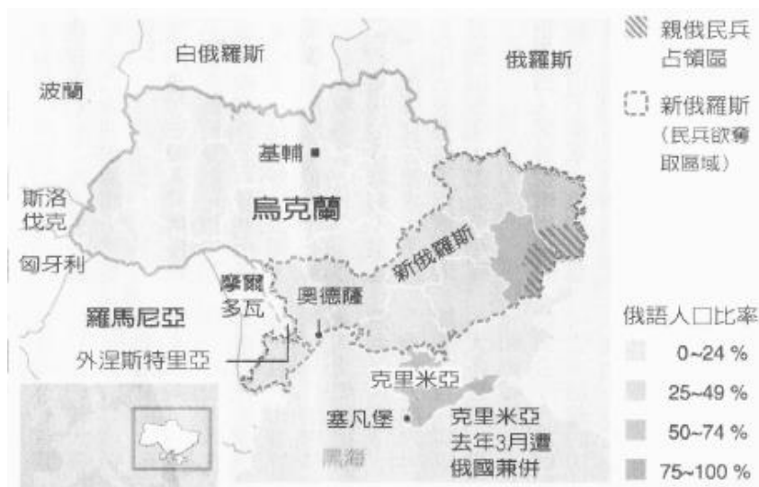
圖1：烏克蘭東部交戰地區和俄語人口比率

2月烏克蘭危機爆發時，被國會取消。由於2014年2月烏克蘭親俄總統亞努科維奇被親歐盟示威者驅逐下台，離開首都基輔之後，位於頓巴斯兩個州的分離主義者在未經烏克蘭政府同意的情况下，自行組織全民公投，分別成立「盧甘斯克人民共和國」與「頓涅茨克人民共和國」，並於2014年5月聯盟而成「新俄羅斯聯邦」（參見圖1）。