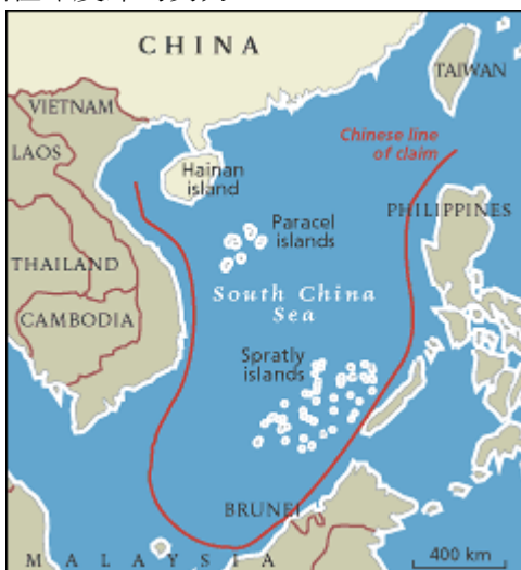
圖 1：中國主張的南海主權

性的浮現，隱含在東協長期防止單一霸權主導東南亞的戰略思維。面對區域權力真空的不確定感，東協國家產生「恐中」情結，卻無「恐印」情緒，除共同對中國的戒懼外，這與印度從未如其他強權干預東南亞事務，亦無歷史仇恨有關，而歷史、宗教文化的淵源，以及二次戰後獨立建國的革命情感，東協國家普遍對印度的印象及情感不惡， 24 要者，印度與東協國家海陸接鄰，亦有防禦合作之必要，因此，面對印度的重現，東協認為印度將對區域穩定、安全及平衡中國做出貢獻。 25 破冰之後，與印度關係最密切的東協國家為新加坡，新加坡前總理李光耀就認為印度應為東協武力平衡的一環，可制衡中國在印度洋的勢力。 26