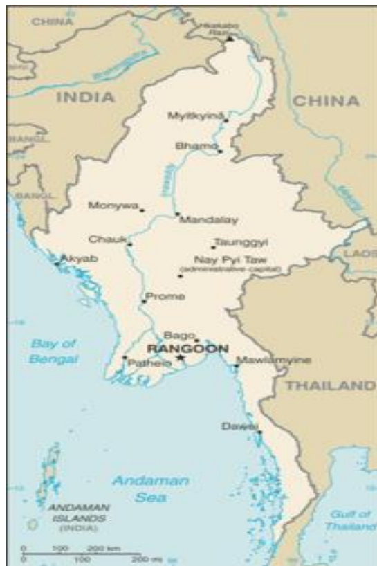
圖 2：印度與緬甸邊界