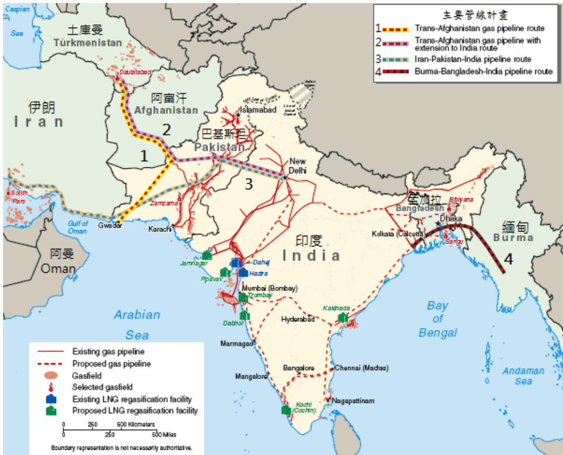
圖 2 印度與週邊國家天然氣管線計畫地圖