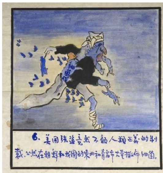
圖一：唐代的胡人塑像