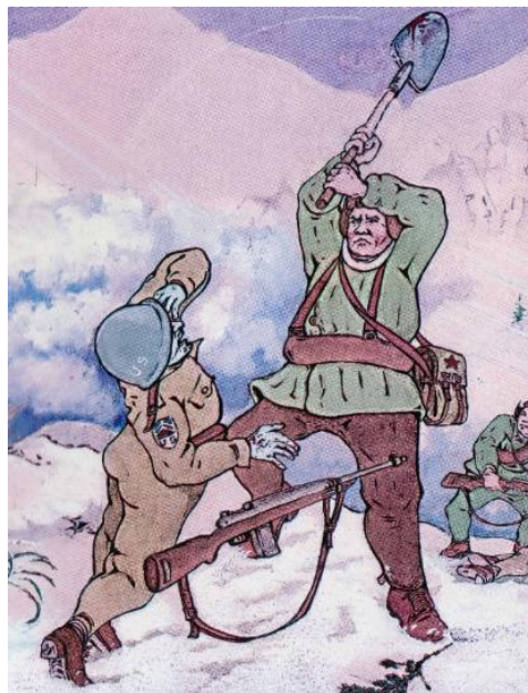
圖四：盟友有高挺的鼻子